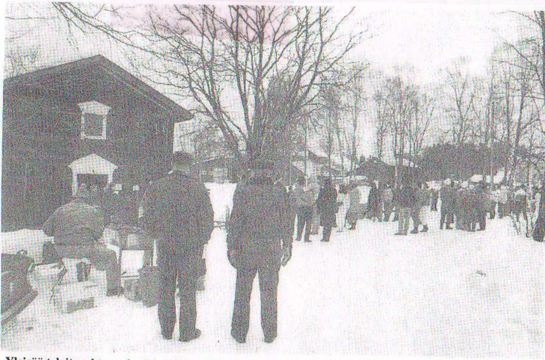
Yleisöä talvitapahtuma keräsi mukavasti. Makkaranmyyntipisteessä ja puffetin puolella sai tyydytettyä pikkunälkäänsä kilpailuja katsellessa.