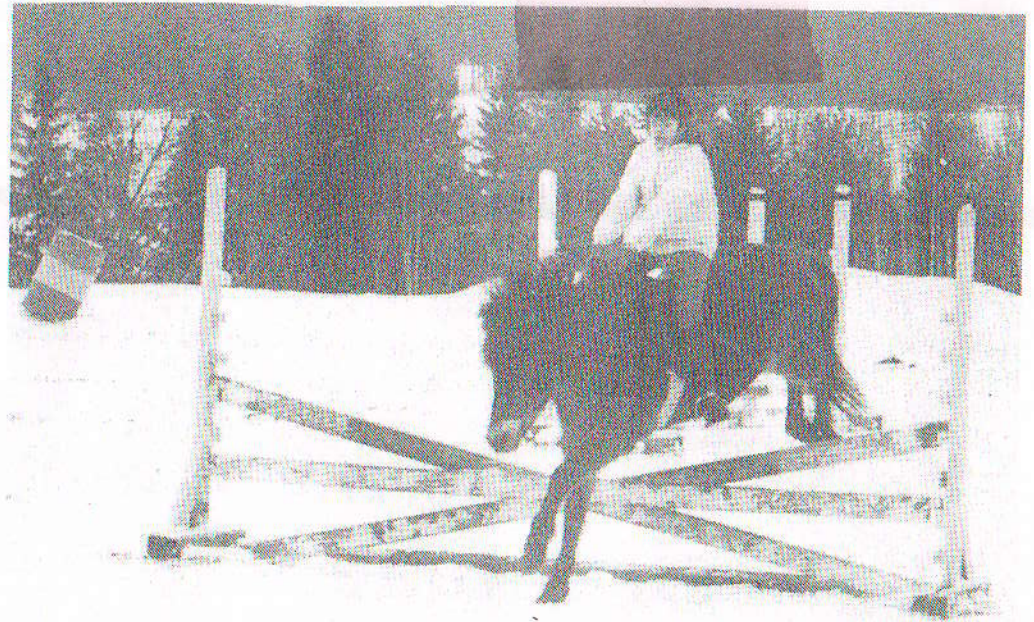
Viestieratsastuksessa ratkaisi aika ja virhepisteet sijoittumisen. Virhepisteitä sai mm. hevosen täydyttyä ylittämästä estettä.